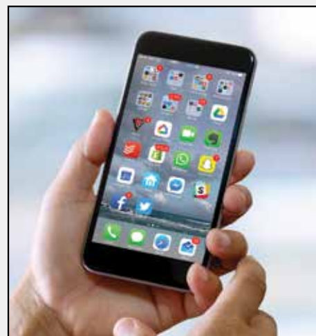
Mobilný telefón cez aplikáciu