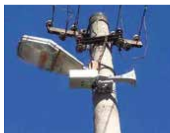
Turňa nad Bodvou